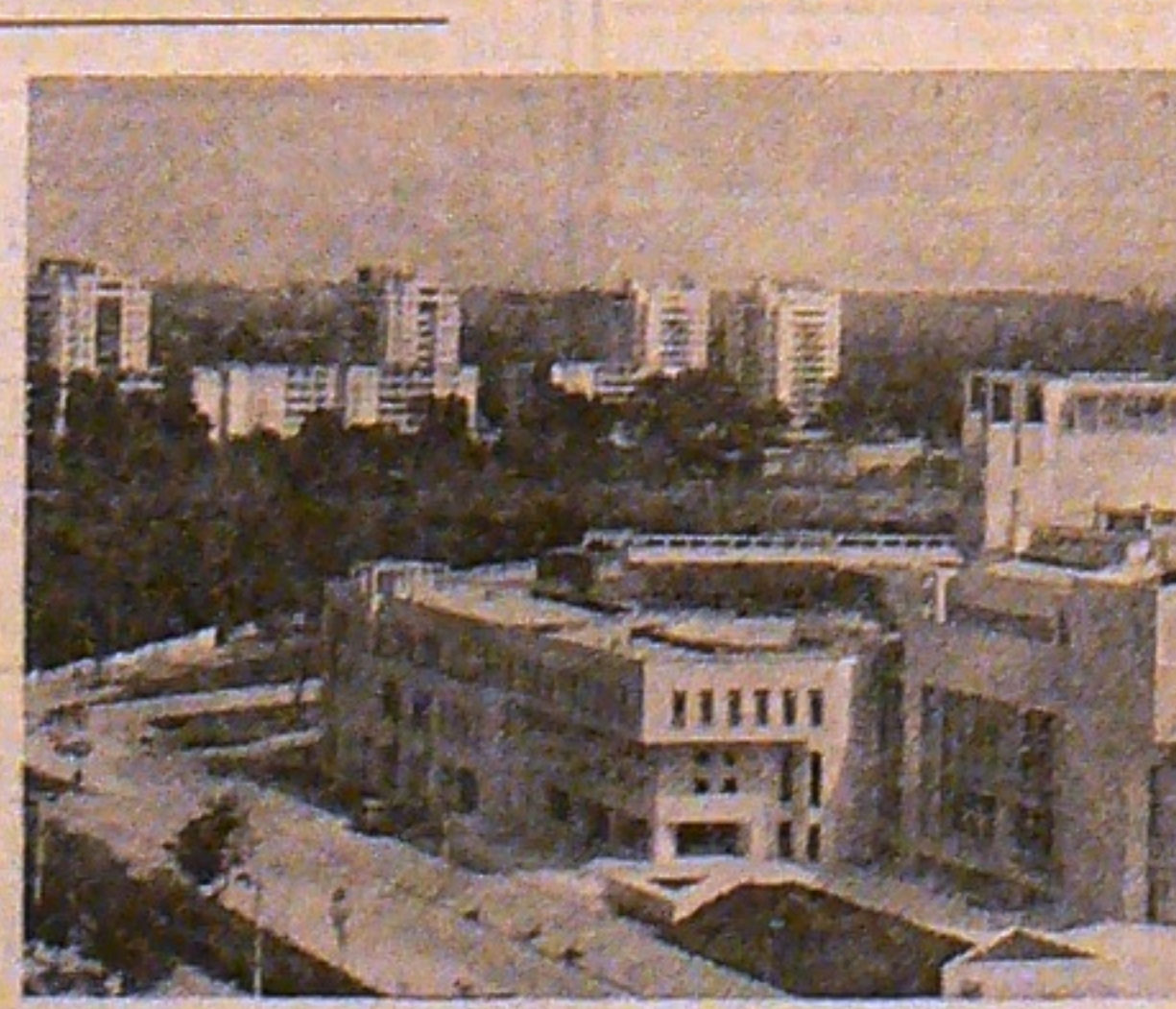
„E CASA VISELOR MĂIASTRE...”

Palatul Pionierilor E casa viselor măiestre, Dor al întregului popor Și treaptă-a devenirii noastre. In săli și-ateliere noi Să răsplătim cum se cuvine Munca depusă pentru noi Pe-nîșne ogoare și-n uzine. Vegheaș pentru noi mereu O lîrute pururi luminată, Conducătorul drag, erou Și-a țării lică minunată. Cînd visurile ne-mplînim Și sîlletul comori adună, Din inimă vă mulțumim Cîntînd pe-a bucuriei strună. Nai în acest frumos palat, Cașă pionieriei noastre, Sîntem ai țării porumbel, Zburînd spre țările albastre.